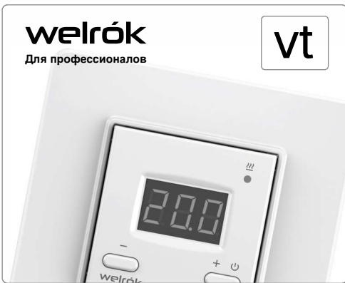
Технический паспорт, инструкция по установке и эксплуатации, гарантийный талон